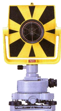
チルト1プリズム・ ターゲット付ユニット