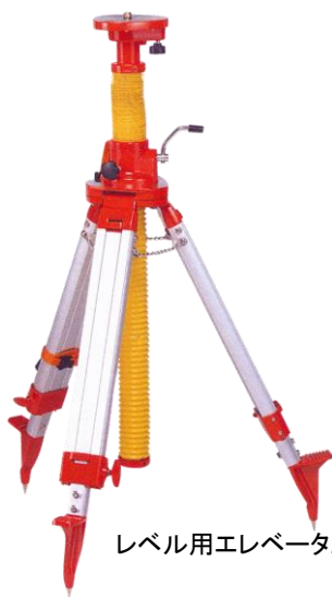
レベル用エレベータ三脚