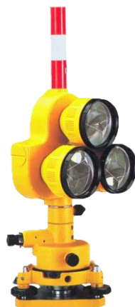
固定3プリズムユニット