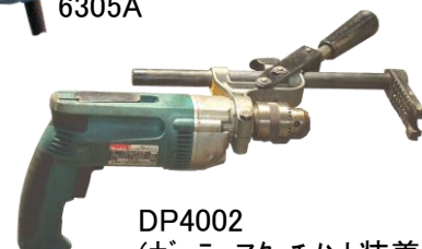
DP4002 (ボラーアタッチメント装着)