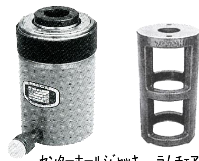
センターホールジャッキ ラムチエア