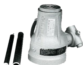
アルミジャーナルジャッキ